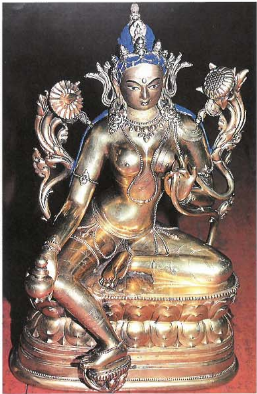
第6詩句のターラーとされる「赤きターラー」。ここでは金箔が施されている。モンゴルの活仏サナハサル作。モンゴル国ウランバートルのボグド・ハーン博物館蔵 (The Eminent Sculptor - G. Zanabazar, Ulan-bator, 1982)。

ターラーが何を怖れぬことを示すという。(8.2) 「悪鬼」はサンスクリット語のマールラ(mara)で「悪」や「悪魔」を意味する。漢字の「魔」はこの語の音写のさいに作られた文字である。仏法の敵。チベット語では「悪魔」や「怪物」を表すドゥ物(bdud)で訳され、モンゴル語では「妖怪」や