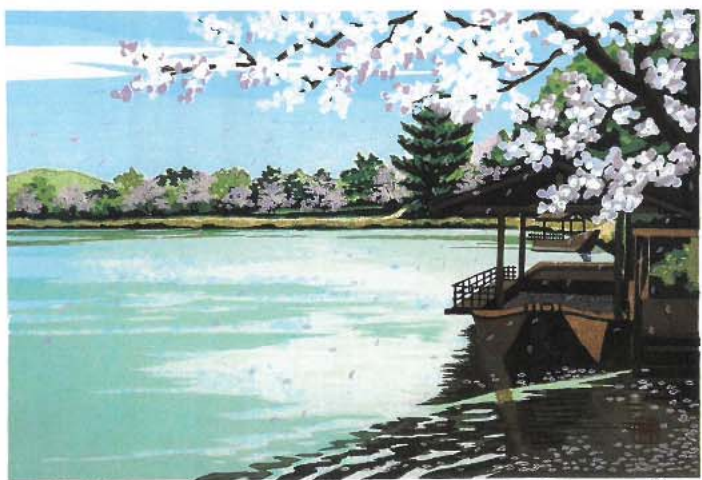
木版画 「春の大沢池」