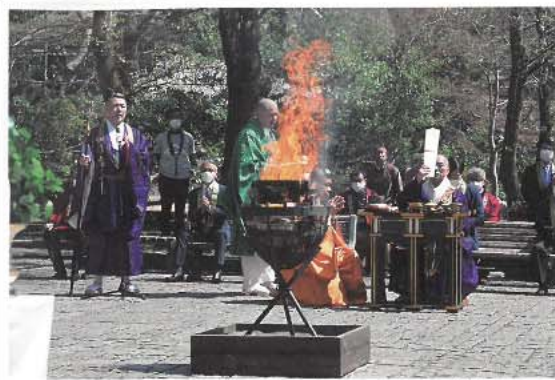
新型コロナウイルス感染症撲滅を祈る御護摩供