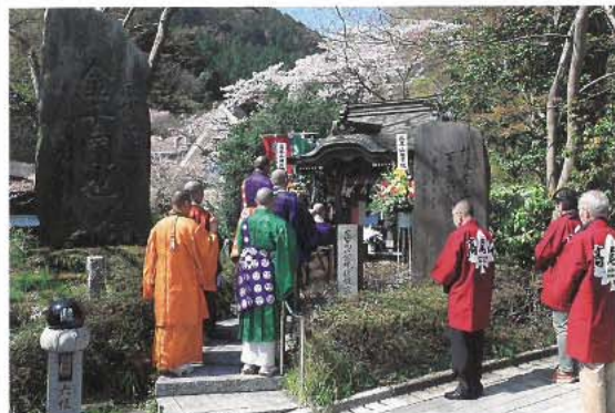
高尾山に訪れる人々の安全を祈願しました