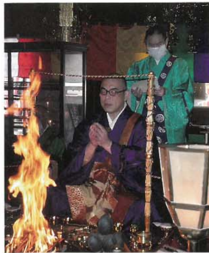
大本堂に於いて春季大祭の大護摩供を奉修

四月十九日、高尾山春季大祭が行われ、大本堂において、新型コロナウイルス感染症の早期終息や国土安穩を祈る大護摩供が厳修されました。 例年であれば、子供たちの健やかな成長を願って、地元中学校のブラスバンドや原獅子舞が参加する、稚児行列が盛大に行われますが、今年は感染症の防止という安全面の観点から、中止と致しました。加えて、絹太鼓の演奏や八王子消防記念会によるはしご乗り等の出し物も中止となりました。 来年の春季大祭では、子供たちの元気な声と、賑やかな出し物が、新緑の高尾山を彩ることを願っております。