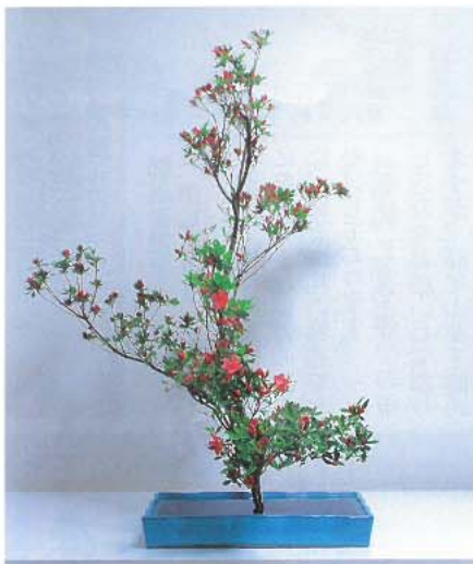
今回の花材：つつじ