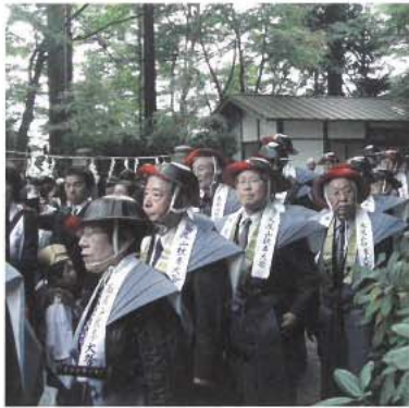
侍衣装を着た慶賛会の皆様

「物で養えて心で滅ぶ」という言葉は、昨今の世相を端的に表現しているようにです。 経済発展の代償として、公害、交通禍、その他様々な弊害が生じ、経済的には豊かになりながらも、心は貧しく刺々しくなり、社会全体が人々の「迷いの心」で覆われております。かかる時代こそ、心に「うるおい」を与える存在として信仰心が必要であり、信仰の温かい心を通して愛情、尊敬、感謝などの心を養い、人間味豊かな社会を建立したいものと念願しております。 高尾山は現在「ミシラン」三つ星を頂き、『心のふるさと祈りのお山』、世界に冠たる高尾の自然」と称され、多くの参拝者が来られています。 こうした恵まれた自然環境の中にある薬王院には、古来より僧侶だけではなく、広く一般からの篤志家に参加して行われる、多くの年中行事が伝承されております。高尾山慶賛会は、こうした各種の行事を奉賛し、以て御本尊を尊信し、その御加護を仰ぎ明るく暖かく、そして豊かな生活を送ることを目的とするものであります。 ぜひとも茲に広く高尾山慶賛会員を募り、ご加入御協賛を頂き、御本尊様の威神力に浴されますよう念願するものであります。