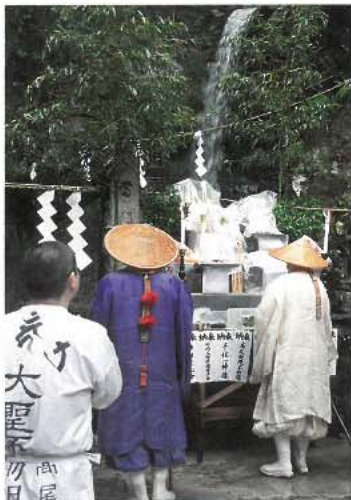
琵琶滝(左)と蛇滝(右)で行われた開瀑式