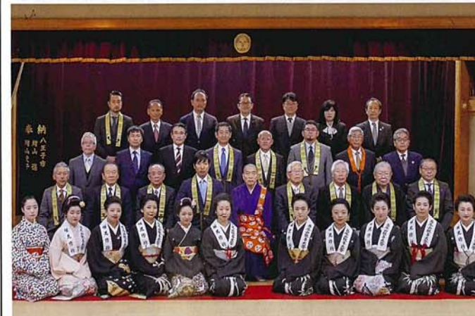
高尾山慶賛会と八王子芸妓組合の皆様による記念撮影