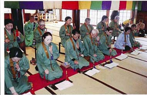
大本堂内での御詠歌奉唱