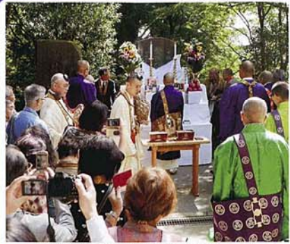
講碑建立の開眼法要が行われた