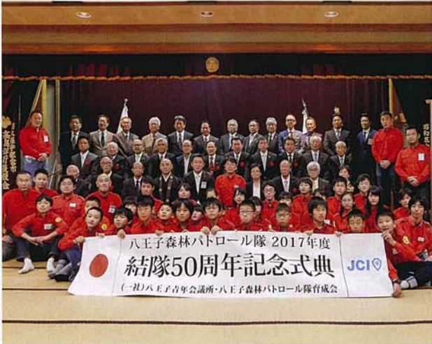
式典に参列された隊員と関係者の方々