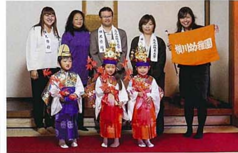
横川幼稚園の園児たちが稚児装束に身を包む