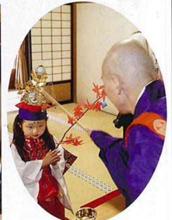
健やかな成長を祈り御加持を授かる