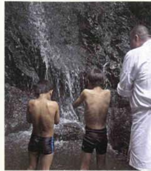
元氣にお滝行をします

その後不動院において、保護者の見守る中、修行を終えた証となる、「修了証」が授けられ、無事に帰宅の途に就いた。