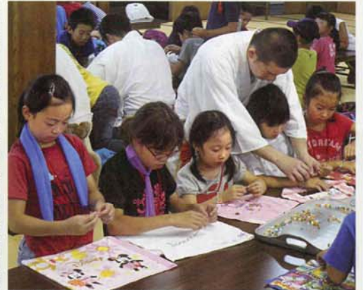
山伏と共に山中を練行し、オリジナルの腕輪念珠と一緒に作る