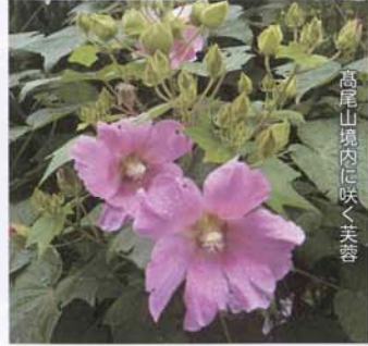
高尾山境内に咲く芙蓉

再開発の始まった豊洲の町！古くからの団地は、あつという間にすっかり壊されて、更地になってしまいました。建物が無くなると、案外の狭さ、ちよつと吃驚！更地の横の道端に、大きな芙蓉の花が咲きました。団地のあつた頃、角の花壇に沢山の芙蓉を育てているおじさんがいて、毎年、背丈位の芙蓉が赤ちやんの顔くらいの花を咲かせて、夏の日差しを浴びていました。赤や青や真っ白や、本当に見事で、楽しみに毎日、眺めに通っておりまして。