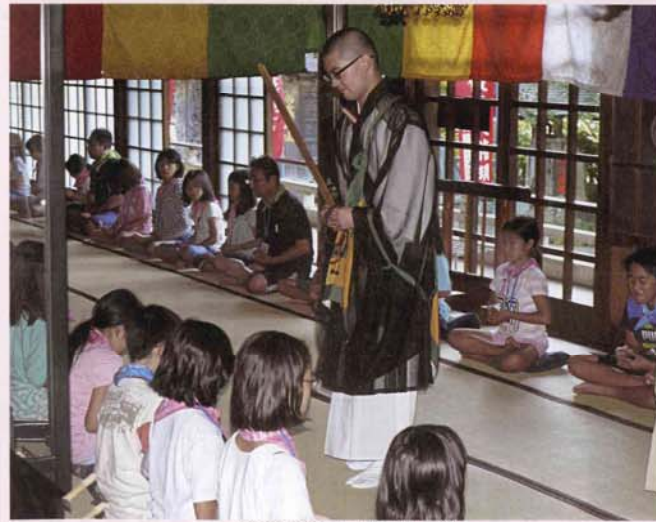
大本堂内で行われた早朝の座禅

子供たちは高尾山頂から、一丁平までを縦走しての自然観察や、室内でのゲーム、早朝には御護摩供・座禅・法話・写経、最後には琵琶滝にて滝行を行い、各修行を通じて心身共にたくましく鍛えられた。