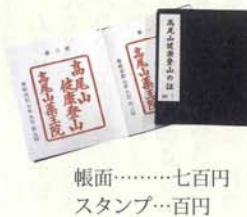
帳面……七百元 スタンプ…百円

また、一冊に付き二十一回スタンプを押すペーシがあり、終了したことを満行と言います。満行されますとお祝い膳として、精進料理の御接待や健康登山者限定の記念品などと交換もできます。