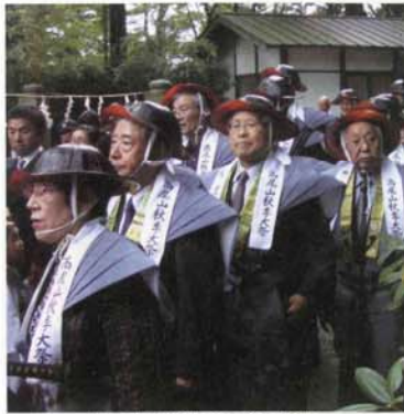
侍衣装を着た慶賛会の皆様

「物で米えて心で滅ぶ」という言葉は、昨今の世相を端的に表現しているようです。 経済発展の代償として、公害、交通禍、その他様々な弊害が生じ、経済的には豊かになりながらも、心は貧しく刺々しくなり、社会全体が人々の「迷いの心」で覆われております。このような時代にこそ、心に「うるおい」を与える信仰が必要であり、信仰の温かい心を通して愛情、尊敬、感謝などの心を養い、人間味豊かな社会を建立したいものと念願しております。 高尾山は現在「ミシユラン三ツ星を頂き、『心のふるさと折りのお山、世界に冠たる高尾の自然』と称せられ、多くの参拝者が来られています。 こうした恵まれた自然環境の中にある薬王院には、古来より僧侶だけではなく、広く一般からの篤志家に参加して行われる、多くの年中行事が伝承されております。高尾山慶賛会は、こうした各種の行事を奉賛し、以て御本尊を尊信し、その御加護を仰ぎ明るく温かく、そして豊かな生活を送ることを目的とするものであります。 ぜひとも茲に広く高尾山慶賛会員を募り、ご加入ご協賛を頂き、ご本尊様の威神力に浴されますよう念願するものであります。