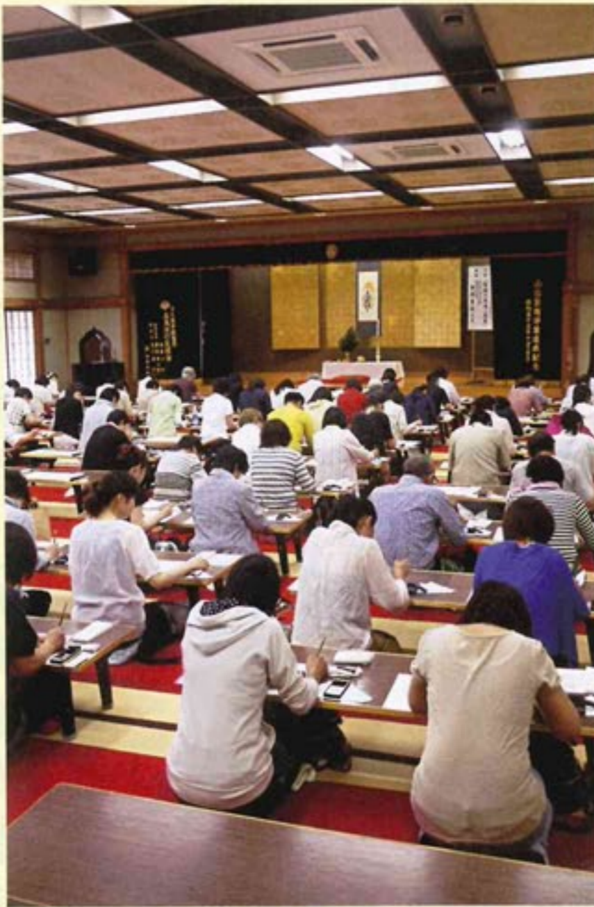
有喜閣での写経の様子

尚、写経に必要な諸道具は、当山にて用意致します。 誠に勝手ながら準備の都合上、お早めにお申込下さい。